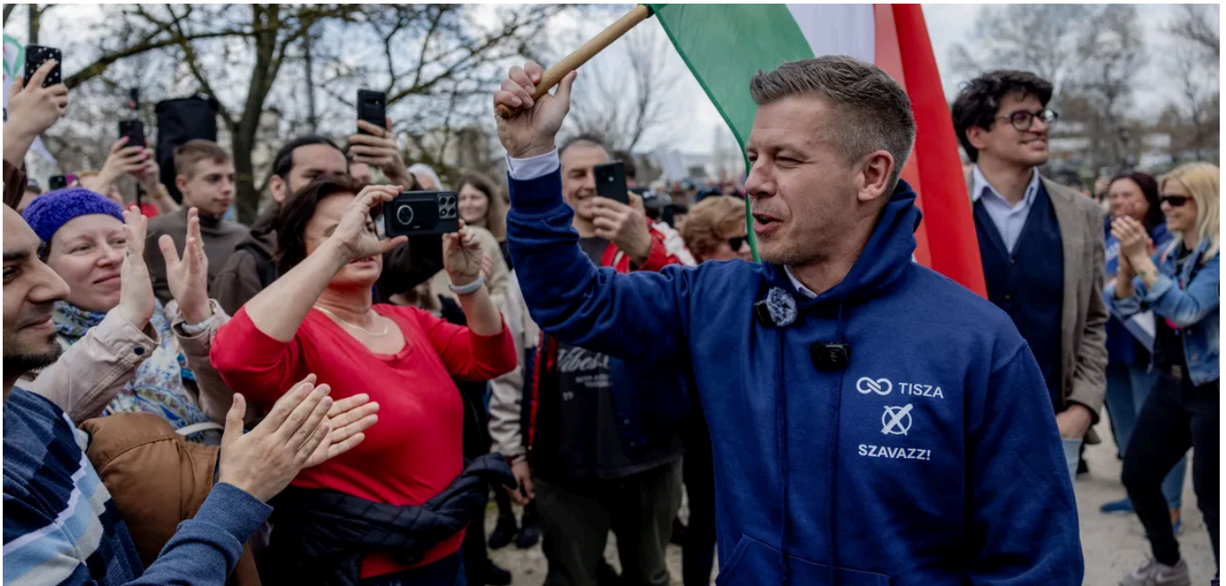
Peter Magyar, Chef der Tisza-Partei