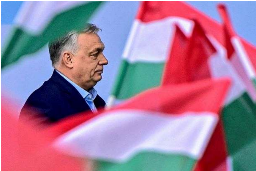
Ungarns Premier Viktor Orbán beim Treffen der sogenannten "Patrioten für Europas" in Budapest.

Dann das rigide Mediengesetz, mit dem Premier Orbán aus dem öffentlich-rechtlichen Rundfunksender und den meisten Printmedien willfährige Propaganda-Instrumente für seine Politik gemacht hat, kann nur mit einer Zwei-Drittel-Mehrheit im Parlament geändert werden. Unabhängige Information ermöglichen in Ungarn zahlreiche kleinere und im Online-Bereich tätige Medien, die von vielen Bürgern mit Spenden unterstützt werden.